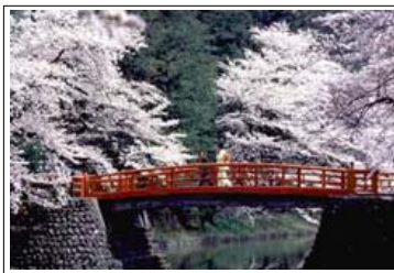
Lo spettacolo dei ciliegi in fiore

Nei bei chiostrini dell'Umanitaria in via San Barnaba si svolgerà la prima edizione di MiJapan Festival , un evento che vuole portare alla conoscenza dei visitatori il grande Paese orientale con la sua particolare cultura, le sue tradizioni e abitudini, i prodotti tecnologici e la vita quotidiana.