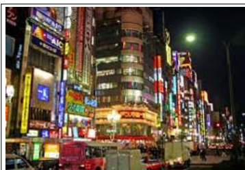
Le innumerevoli luci di Tokio

L'iniziativa è stata organizzata dall' Associazione EuJapan con il patrocinio del consolato nipponico e del Comune di Milano con alcune marche giapponesi come sponsor e prevede tre giorni di manifestazioni di vario genere, dalle arti marziali all'origami, dal rito del tè allo shiatsu, dai manga all'ikebana, oltre a un'esposizione tecnologica e un concerto di musica corale giapponese. Parte dei proventi